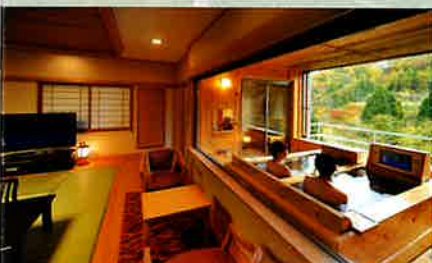
【プライベート半露天寝湯(客室)】 Private out-side Bathroom

あ つ た か い 湯 と 美 し い 景 色 銀山川の清流のせせらぎ、 野鳥のさえずり、葉ずれの音…。 当館自慢の露天風呂は、 仙峡の宿にふさわしい 幽玄な雰囲気をかもしだします。 湯けむりの向こうにひろがるのは 春は新緑、秋は紅葉、 そして冬は一面真っ白の雪景色。 耳と目と、肌で体の芯から くつろげる瞬間を感じて下さい。