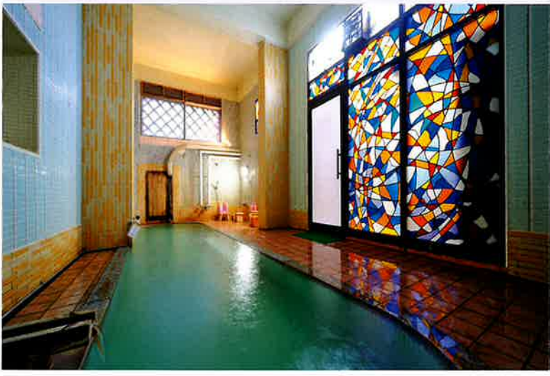
大浴場【ほっこりのちか湯】

山・海の旬な素材を 厳選して盛り込んだ古勢起屋別館の あたたかみのある郷土料理。 真心を込めて…。 四季折々の風情を 存分に感じながら、 自慢の料理を どうぞご堪能下さい。