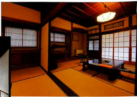
【川側の客室の一例】 Guest Room

大正ロマンの香り漂う 古勢起屋別館は、銀山温泉の ほぼ中央に位置します。 川側には落ち着いた 書院造りの和室と 山側には静かな和洋室。 源泉かけ流しの お風呂でくつろぎ、 滋味あふれる 郷土料理に舌鼓…。 ゆったりとした時間を お楽しみください。