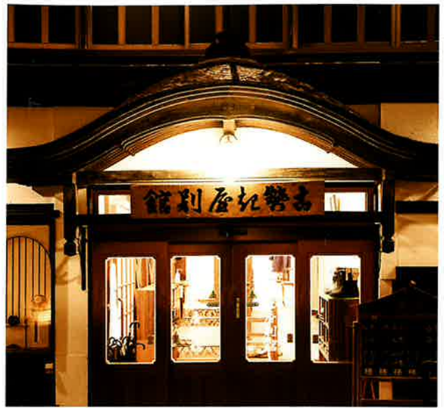
【古勢起屋別館 外観】 Externals of KOSEKIYA BEKKAN