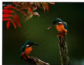
【かわせみ】 King fisher 客室からのバードウォッチングも 楽しめます。