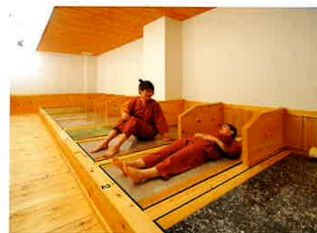
【岩盤浴「多雅舎奈瑠」 (ターシャナル)】