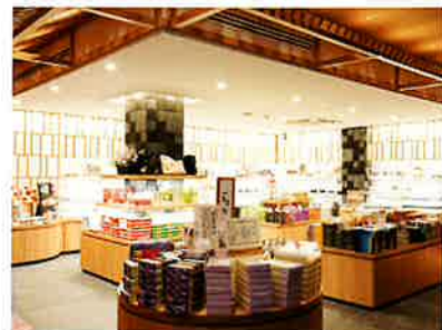
【セレクトショップ】