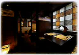
【会食場】 Dining space

山・海の旬な素材を 厳選して盛り込んだ古勢起屋別館の あたたかみのある郷土料理。 真心を込めて…。 四季折々の風情を 存分に感じながら、 自慢の料理を どうぞご堪能下さい。