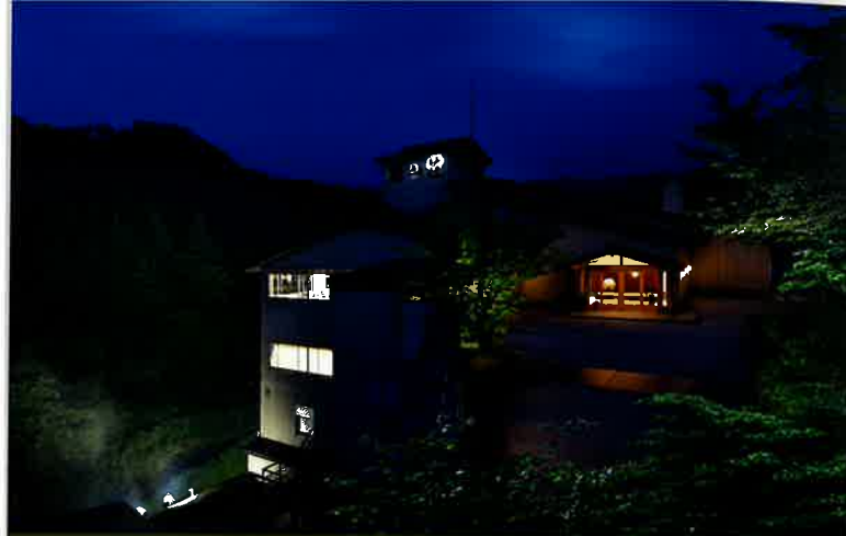
【銀山荘 外観】 Externals of GINZANSO

部屋の、大きな窓から見える 尾花沢の美しい自然。 萌える木々と湖、川辺に棲む動物。 日中の眺めはいつしか ライトアップされた夜景に…。 暖かい灯りに包まれた室内の なんと居心地の良いこと。 仙峡の宿、それは、 時間と遊ぶ住処。