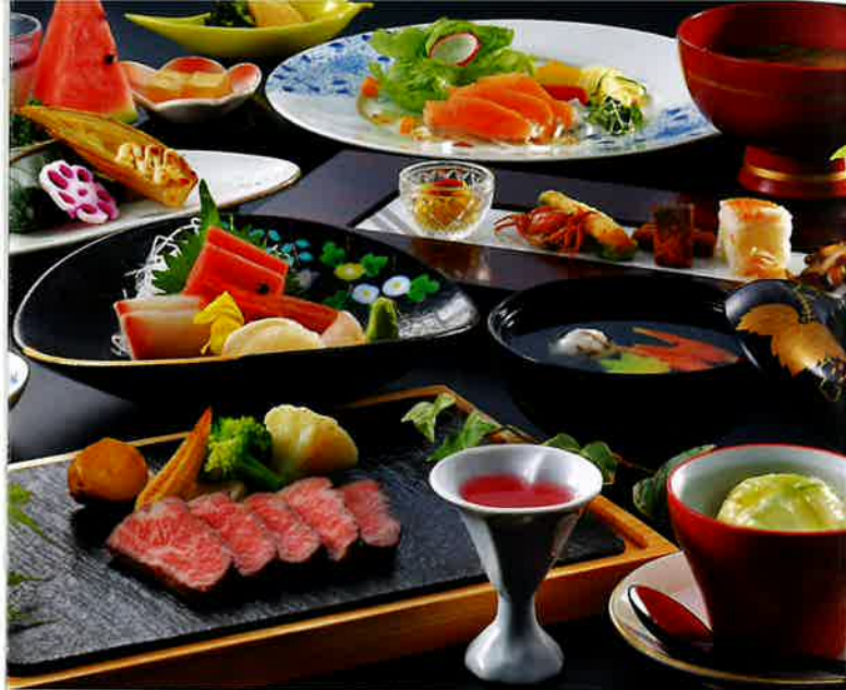
イメージ【会席膳】 【温泉街】