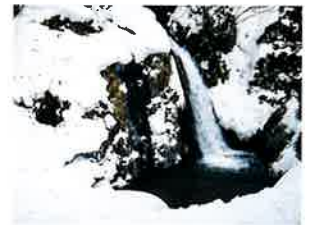
【滝つぼ】 Basin of a waterfall 清々しい風情を感じさせる宿周辺 の散策コース。