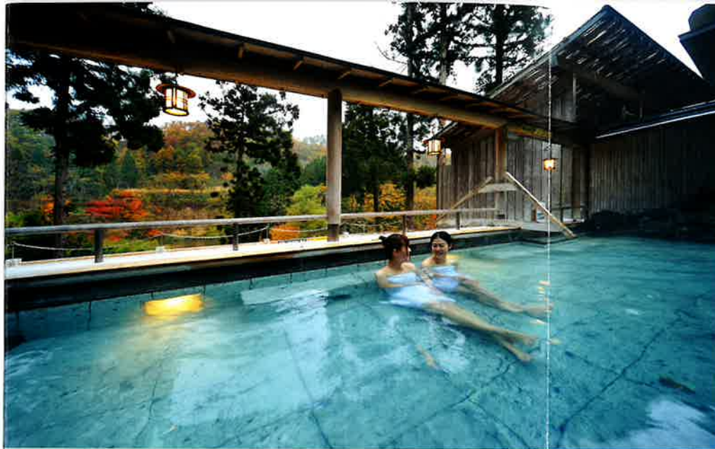
【露天風呂】 Out-side Bathroom